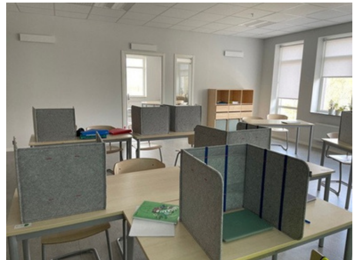
Ett högstadielklassrum förberett för prov.