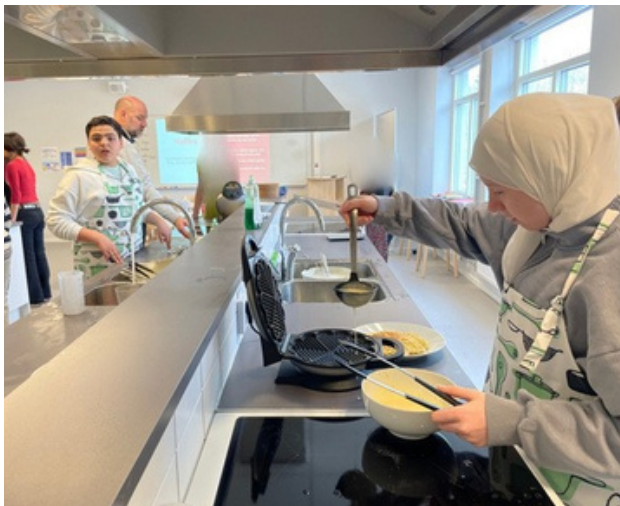
Åk 6 gör våfflor på hemkunskapen.

Denim day - då personal och elever klär sig i denim för att visa sitt stöd till offren för sexuella övergrepp.