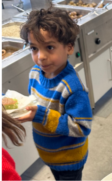
Lågstadieelever som hjälper till att bära bort tallriken och torka bord efter lunchen