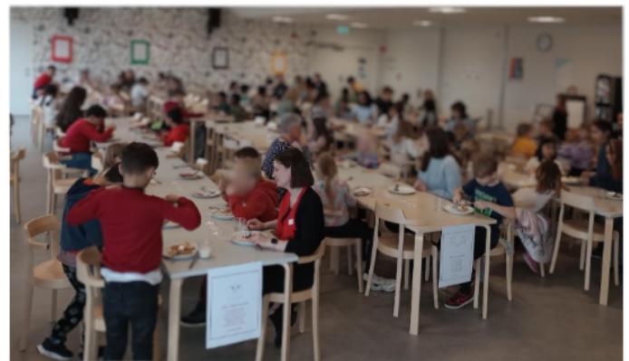
Kul på jobbet